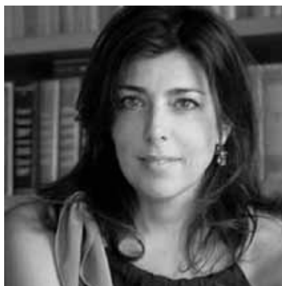
Costumi Alessandra Torella