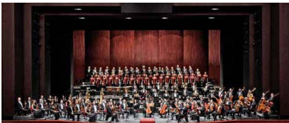
Orchestra e Coro Teatro Regio Torino