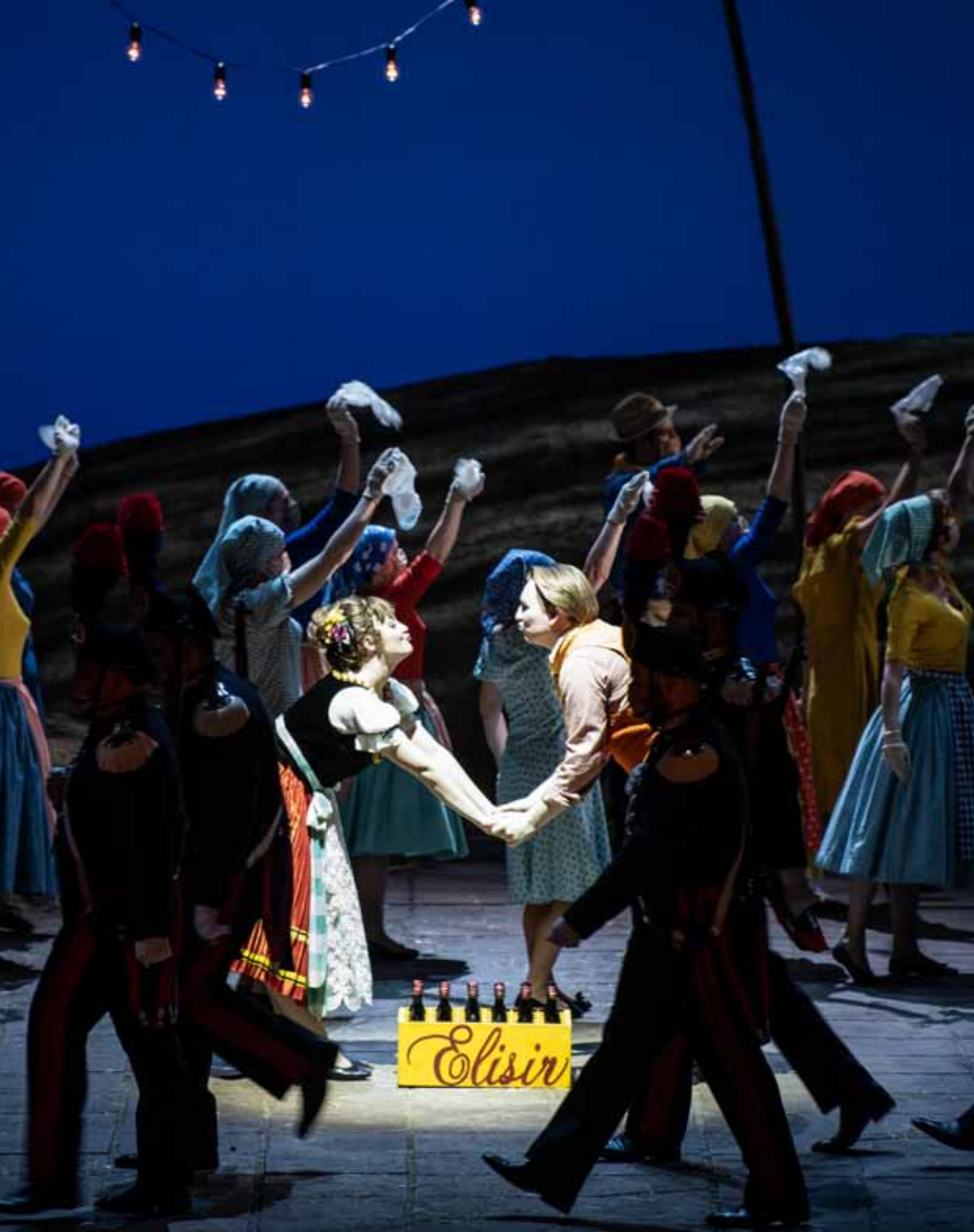
Il finale dell' Elisir d'amore rappresentato al Teatro Regio nel 2021; regia di Fabio Sparvoli, scene di Saverio Santoliquido, costumi di Alessandra Torella; allestimento Teatro Regio Torino.