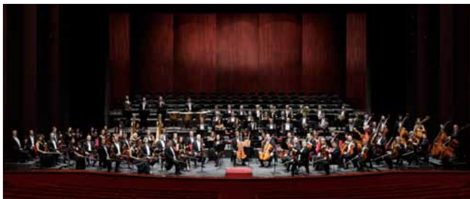
Orchestra Teatro Regio Torino