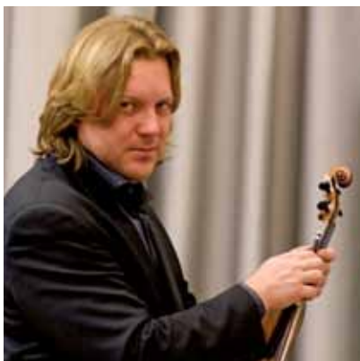
Maestro concertatore Sergey Galaktionov

Clicca sulla foto per leggere la biografia online