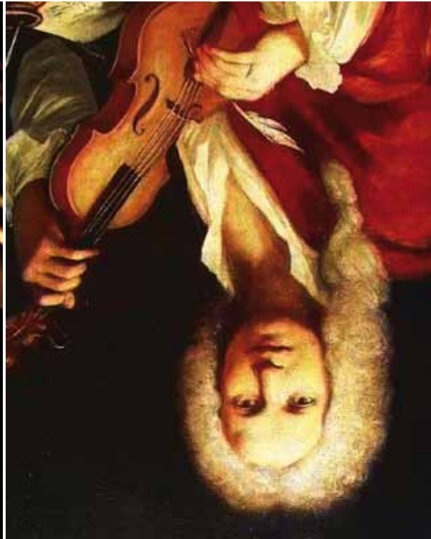
Antonio Vivaldi, nel celebre ritratto presunto, datato 1723 circa, e Astor Piazzolla, in una foto degli anni Ottanta.