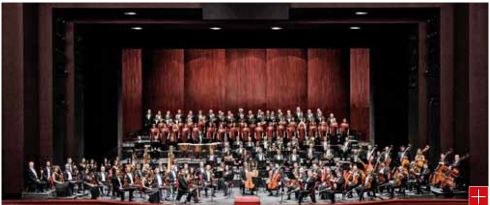
Orchestra e Coro Teatro Regio Torino