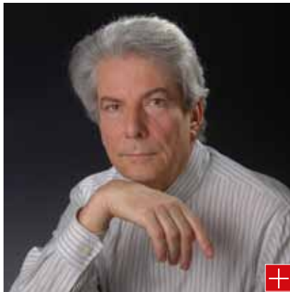
Direttore Hartmut Haenchen