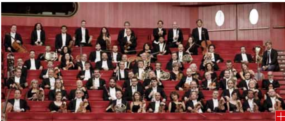
Orchestra Teatro Regio Torino